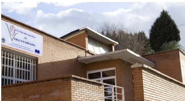
C. SOCIAL CASAS DEL REY. OFICINA MUNICIPAL DE VOLUNTARIADO.