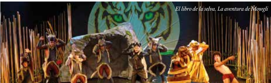
El libro de la selva. La aventura de Mowgli