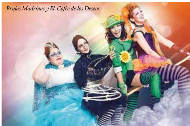
Brujas Madrinas y El Cofre de los Deseos

Qué pasaría si un tímido muchacho de provincia que quedó viudo, acogiese en su casa a una chica de vida alegre junto a su madre y su tía. Algo así debió preguntarse el autor al escribir esta obra.