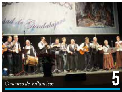
Concurso de Villancicos