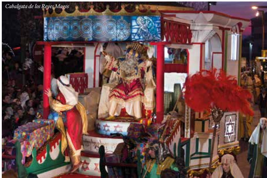
Cabalgata de los Reyes Magos