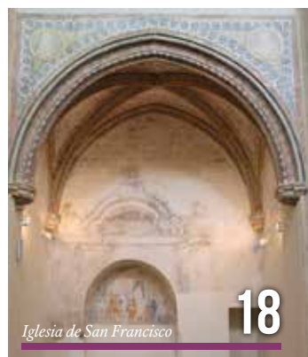
Iglesia de San Francisco