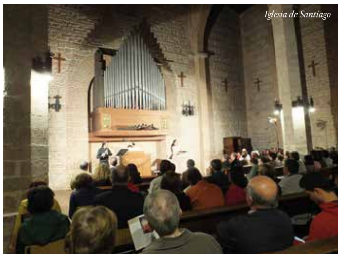
Iglesia de Santiago