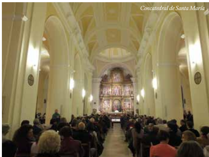
Concatedral de Santa María