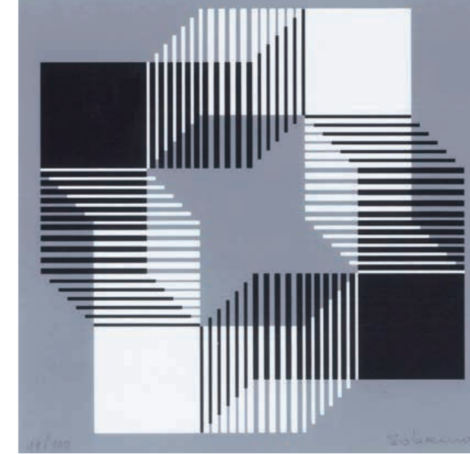
Relación Blanco Negro, 1988-2002