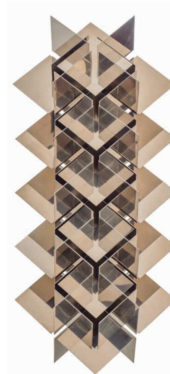
Museo Francisco Sobrino GUADALAJARA