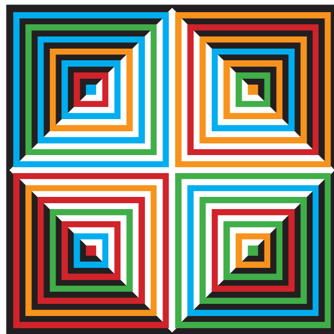
Blanco-Negro-Color, BNC, 1990

En estos NBC , el principal objetivo pasa por presentar sencillas composiciones de cuadrados, agrupados de cuatro en cuatro, en progresión sistemática y concéntrica de color para formar otro paralelogramo mayor en plano virtual y latente. Aquí, hemos querido intuir la interferencia de las puntas de diamantes del Palacio del Infantado, y, por lo tanto, aventurar una estrecha ligazón entre el genial maestro alcarreño del arte óptico y cinético y el monumento más singular de su ciudad.