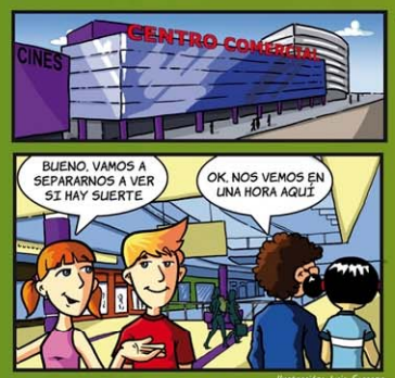
Ilustración: Luis Serrano Diseño y maquetación: mikerestudio.com