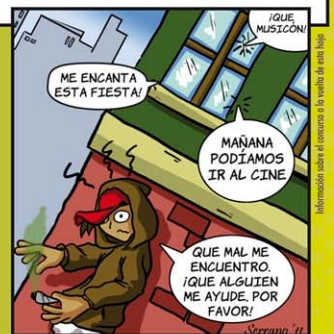
Ilustración: Luis Serrano