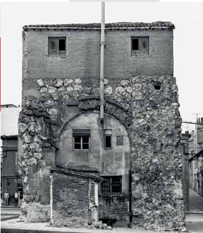
Puerta de Bejanque, 1989