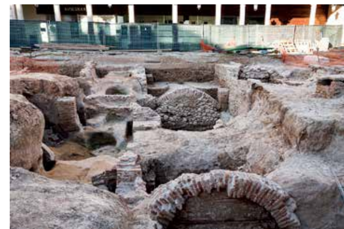
Subsuelo de la plaza Mayor, 2009