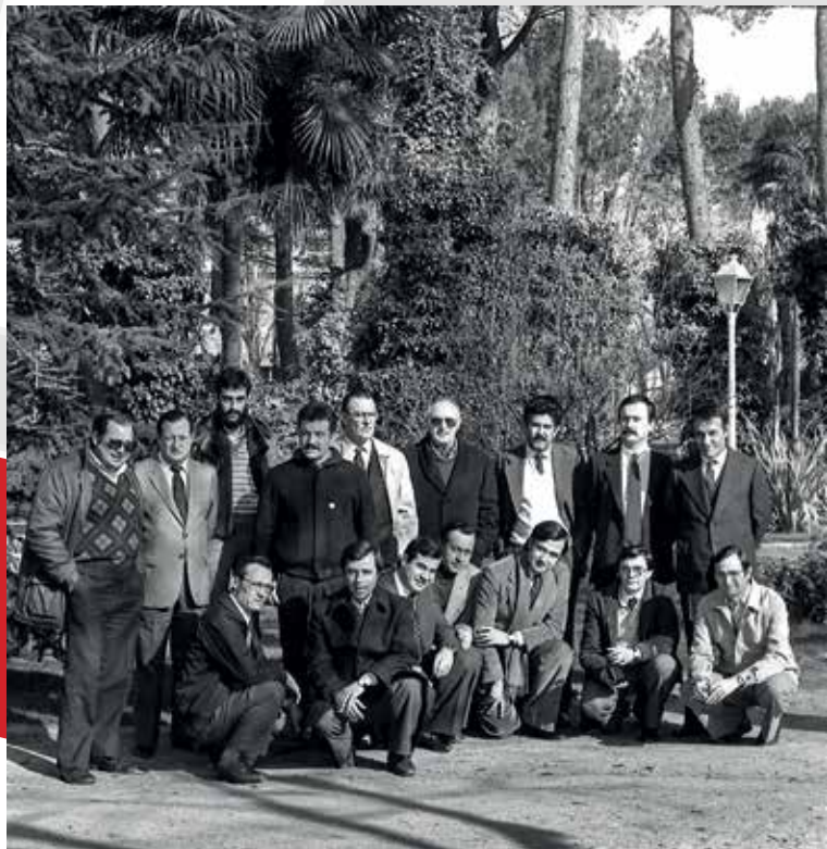
Primera corporación municipal de la transición democrática de Guadalajara, 1983