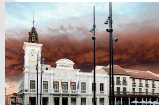
Nube del incendio de Chiloeches, 2016