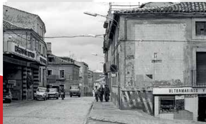
Calle Ingeniero Mariño, 1984