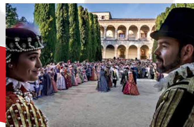
Recreación de la boda de Felipe II e Isabel de Valois, 2016