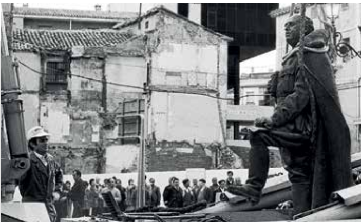
Retirada de la estatua de Francisco Franco, plaza Mayor, 1985