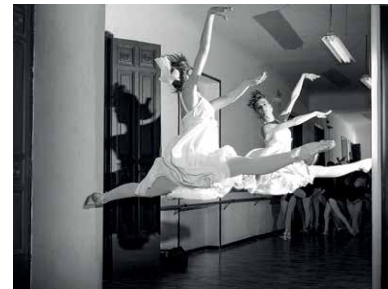
Marina. Escuelas del palacio de La Cotilla, 1985