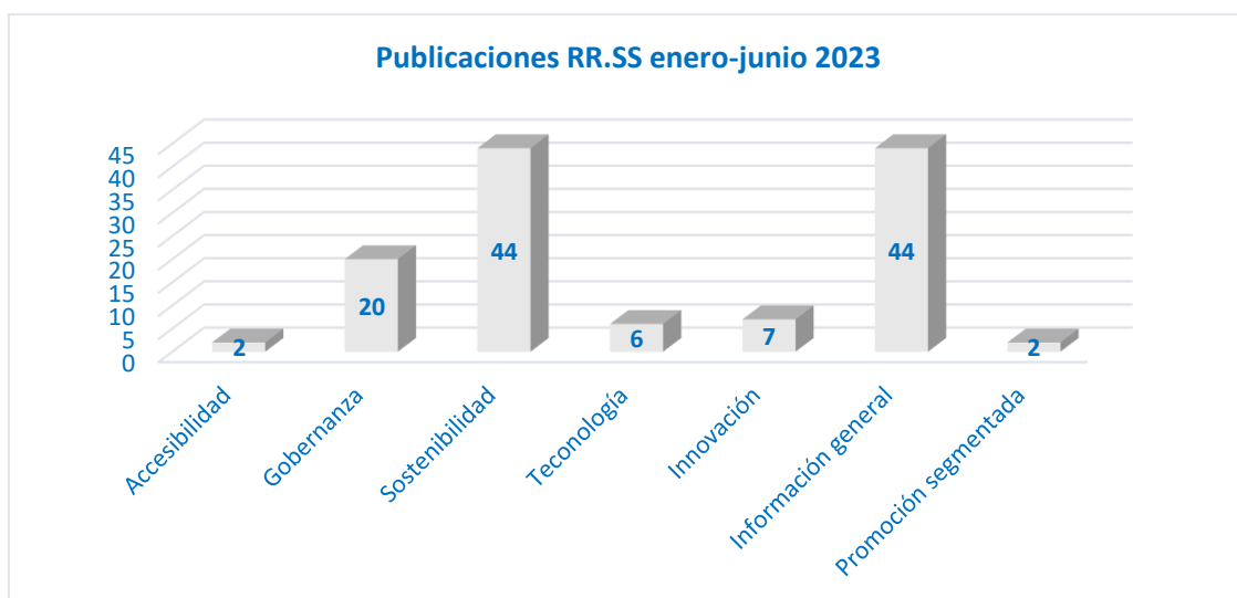
Gráfico 1. Publicaciones RR. SS enero-junio 2023

Así, si se clasifica todo el contenido que se ha publicado en el primer semestre de 2023, teniendo en cuenta los pilares sobre los que se sustenta el concepto DTI, se observa que los contenidos mayoritarios están vinculados con el eje de Sostenibilidad y en ofrecer Información General del destino, representando entre los dos un 80% de las publicaciones totales. Por su parte, el apartado de Gobernanza cuenta con 20 publicaciones a lo largo de este semestre, un 18% del total, mientras que Innovación y Tecnología se ven reflejadas en 6 y 7 de las publicaciones, y finalmente la Accesibilidad sólo en 2 de ellas ( Gráfico 1 ).